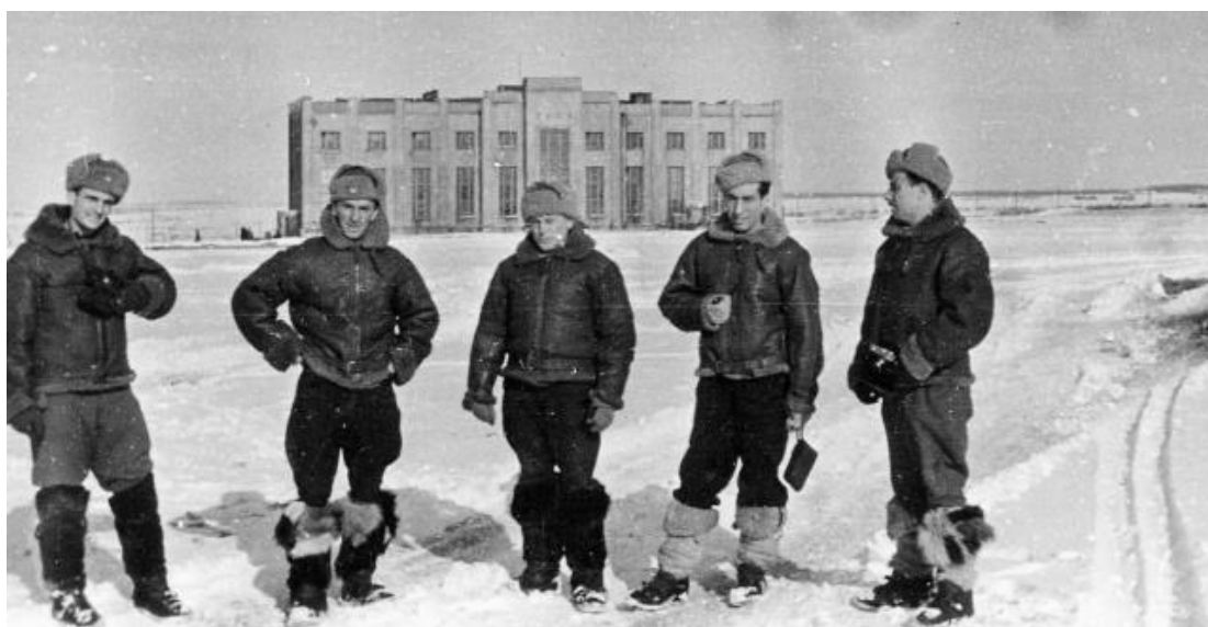
Советские пехотинцы ведут бой на улице Венёва. Тульская область.