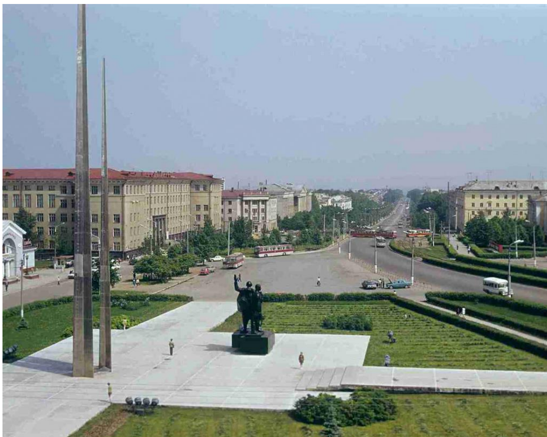
Площадь Победы. В центре площади — памятник Защитникам Тулы в Великую Отечественную войну.

Рядом с этими фигурами взметнулись над площадью стальные обелиски в виде трёх штыков высотой 31, 41 и 51 метр, символизирующих непобедимость русского оружия и советского народа-героя. В этот ансамбль входит Вечный огонь, зажжённый от Вечного огня на Могиле Неизвестного Солдата в Москве.