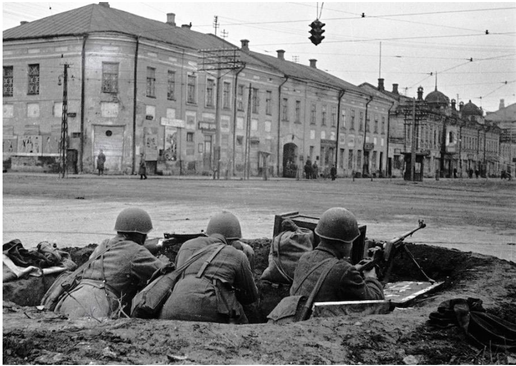
Солдаты ведут наблюдение из окопа на улицах Тулы.