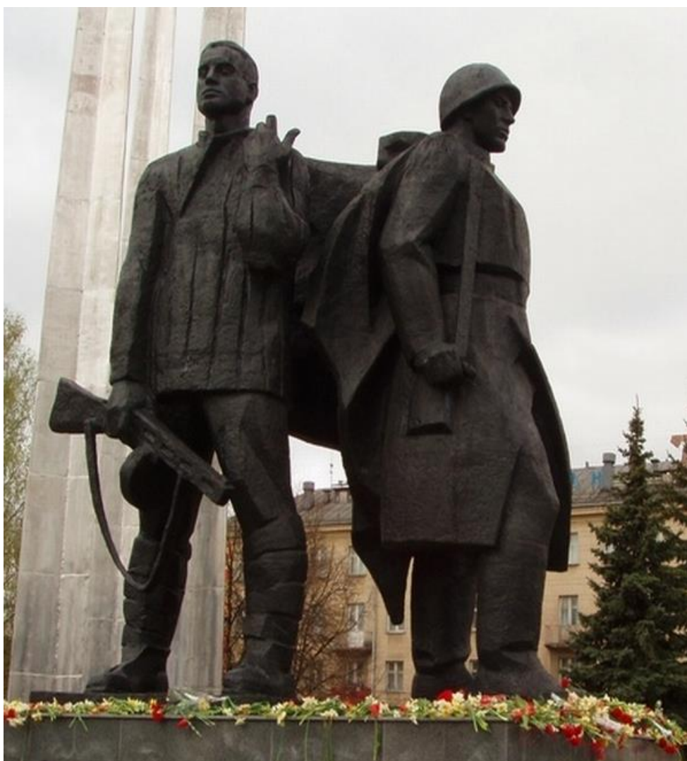
СКУЛЬПТУРНАЯ ГРУППА «СОЛДАТ И РАБОЧИЙ» ВЫСОТОЙ 4 МЕТРА ЯВЛЯЕТСЯ ЧАСТЬЮ ПАМЯТНИКА «ГЕРОИЧЕСКИМ ЗАЩИТНИКАМ ТУЛЫ». ПАМЯТНИК ОТКРЫТ 16 ОКТЯБРЯ 1968 ГОДА

Событиям Великой Отечественной войны в городе-герое Туле посвящено несколько памятных мемориалов. На площади Победы воздвигнут монумент в честь героев-защитников. Он представляет собой четырёхметровую парную скульптуру солдата и ополченца, стоящих плечом к плечу с автоматами в руках. Скульптурная группа установлена на невысокий постамент, на котором высечены слова: «Героическим защитникам Тулы, отстоявшим город в 1941 году».