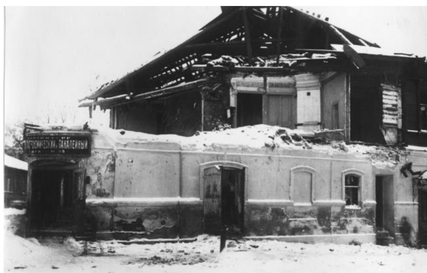
На улицах Тулы. 1941

12 октября немцы вошли в город Алексин, спустя две недели были уже в Щекино. Гитлеровцы прорвали оборону 290-й стрелковой дивизии и двинулись к Туле. Уже 29 октября передовые части гитлеровских войск подошли к Туле, заняв фактически без сопротивления Ясную Поляну, металлургический завод, посёлок Косая Гора, Ивановские Дачи. Немецкие