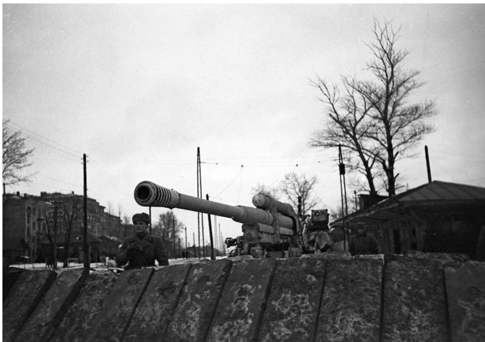
Советские солдаты на огневой позиции на окраине города Тулы. Снимок был сделан в декабре 1941 года.

На захват Тулы противник бросил лучшие войска: полк «Великую Германию», 1 моторизованную и 3 танковых дивизии. С мужеством и отвагой на оборону города встали герои рабочей гвардии, в сражениях приняли участие зенитчики и чекисты.